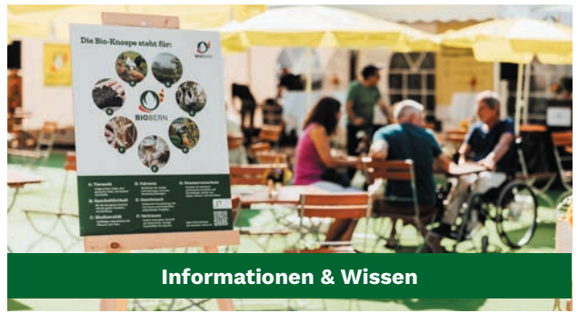
Informationen & Wissen